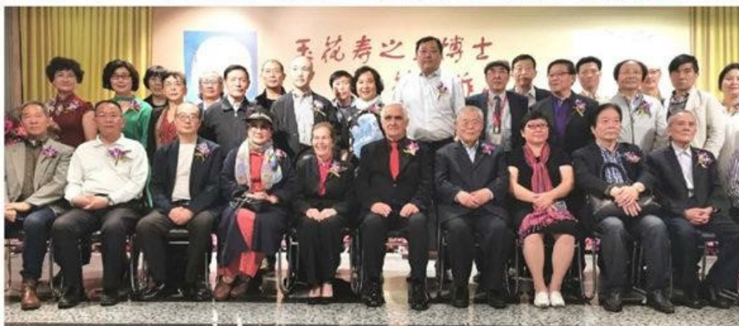
玉花壽之王博士藝術作品展開幕亮展現場

中評社上海5月20日電（作者 常志康）由上海中外文化藝術交流協會主辦的玉花壽之王博士藝術作品展5月18日開幕亮展。