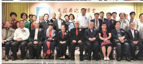
玉花壽之王博士藝術作品展開幕亮展現場